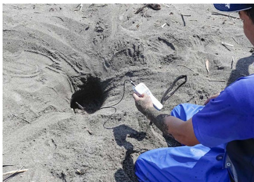
産卵場所の温度計測